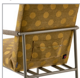
Optional hotfrog: beheizbares Stuhlkissen