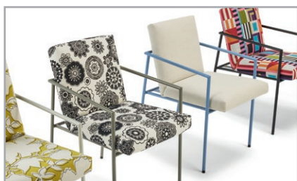
Untergestell wahlweise in 4 Farben erhältlich