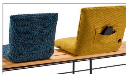
Optional Funktionskissen oder beizbares Funktionskissen - hotfrog (Powerbank nicht im Lieferumfang enthalten)