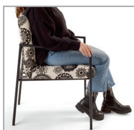
Lose eingelegtes Kissen ermöglicht eine Individuelle Sitzposition