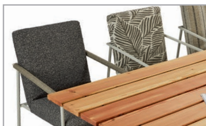
Optional Metalluntergestell mit oder ohne gewickeltem Armteil