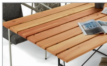
Verschiedene Outdoorhölzer zur Auswahl