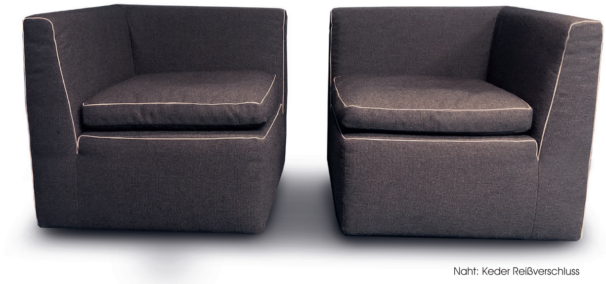
Naht: Keder Reißverschluss